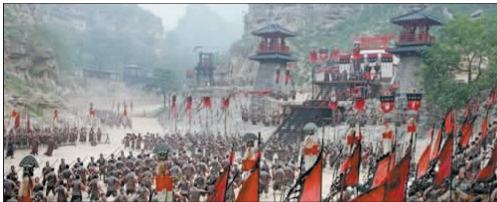
影片《赤壁》在美国市场票房仅收获56万美元。