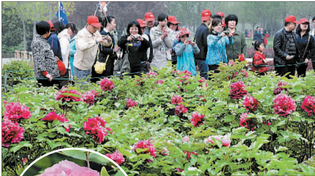
春光好,牡丹艳,赏花游人如织。 摄于中国国花园