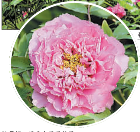
映日红 摄于中国国花园