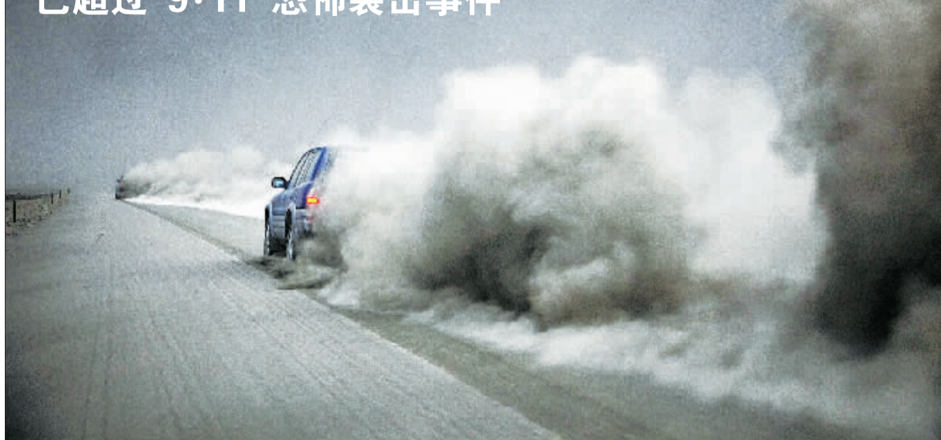
4月15日,在冰岛东部,科学家对火山灰进行取样后乘车离开。

据新华社北京4月18日电 冰岛火山烟尘继续影响欧洲空中交通,世界各国与欧洲的空中往来也受到严重影响。目前仍有近20个欧洲国家实行航空管制。