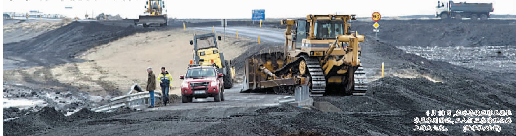
4月18日,在冰岛埃亚菲亚德拉冰盖冰川附近,工人们正在清理公路上的火山灰。

据新华社雷克雅未克4月19日电 冰岛国家广播电视台19日报道,正在喷发的埃亚菲亚德拉冰盖冰川附近的一座火山目前活动强度有所降低,火山烟尘的生成速度已放缓。