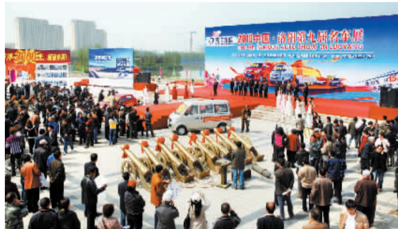
盛大的开幕式场景。

今年的名车展共有 58 个汽车品牌报名参展,参展车型多达 360 余款。既有宝马、奔驰、英菲尼迪、斯巴鲁、进口大众这样的世界顶尖品牌,也有北京现代、东风本田、东风日产、上海大众等国内主流合资品牌,还有比亚迪、奇瑞、江淮、吉利等物美价