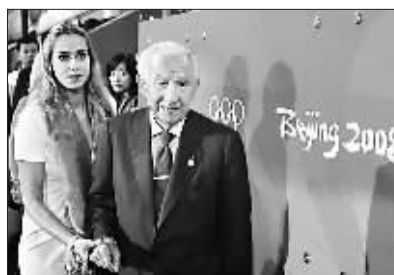
萨马兰奇观看北京奥运会比赛。