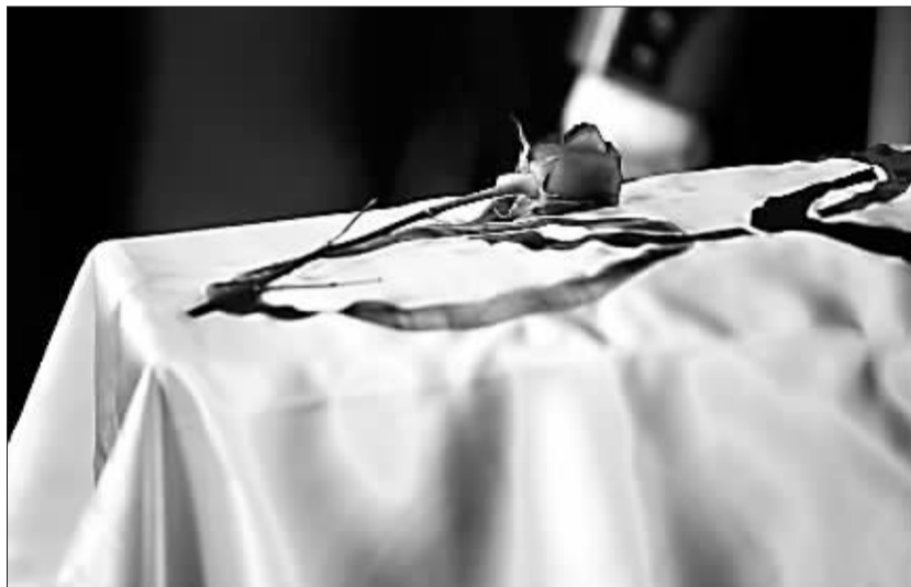
4月22日，萨马兰奇的遗体告别仪式在西班牙巴塞罗那举行。