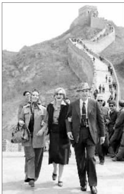
1978年，萨马兰奇(右)在长城游览。