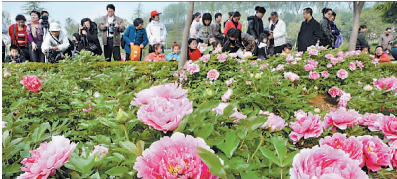
中国国花园内,娇艳的牡丹让游客流连。