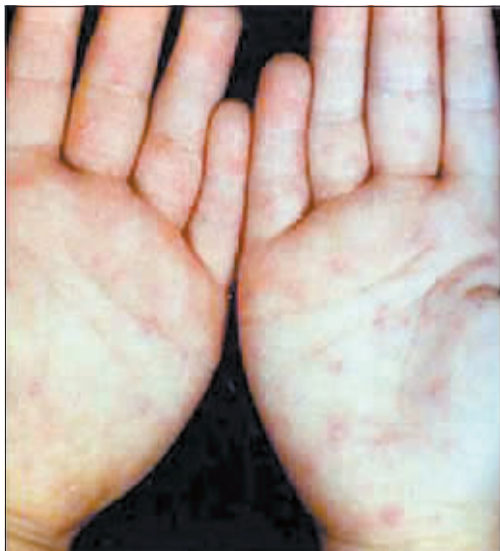
手足口病的症状。(资料图片)