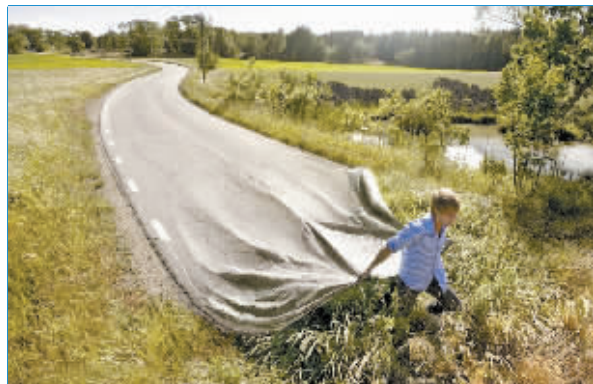
酷图酷说 他在拉着公路奔跑。