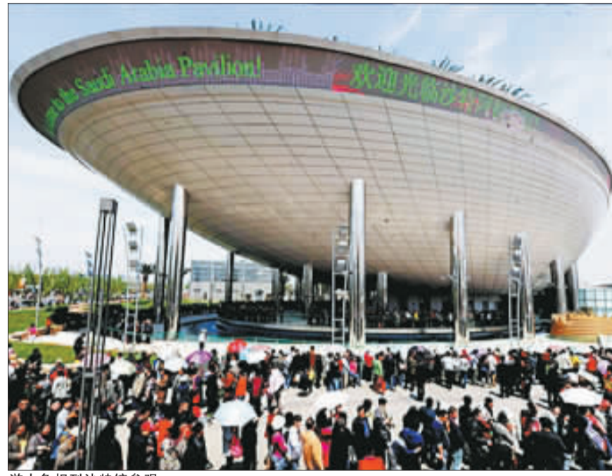
游人争相到沙特馆参观。

沙特人提出的标准令他们意外：“符合主题，体现沙特地域特色，展示现代风貌，当然还有绿色环保。”