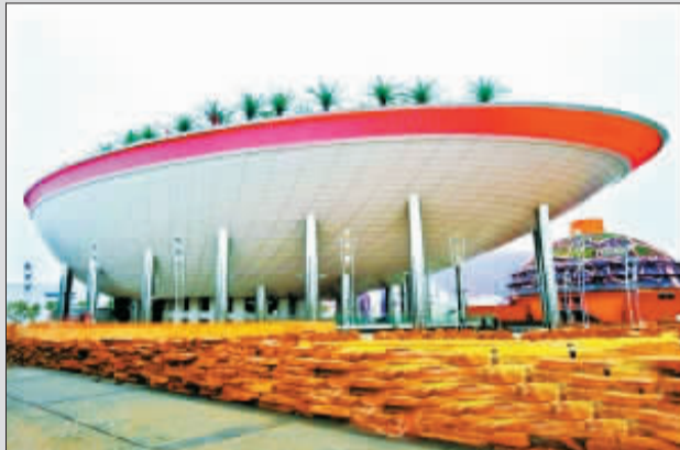
外形如船的沙特馆。

由于耗资不菲，上海世博会上 42 个被确定为临时性建筑的外国自建馆在闭幕后命运如何一直受关注。格贝尔透露，世博会组织方已通知各馆，在世博会期间将有一次“选美大比拼”，公认最美丽的 5 个自建馆将被永久保留。他非常希望，卢森堡馆能被“选”中。记者在园内听到，多个国家均积极申请，希望本国美轮美奂的展馆能被选中永远留在中国。