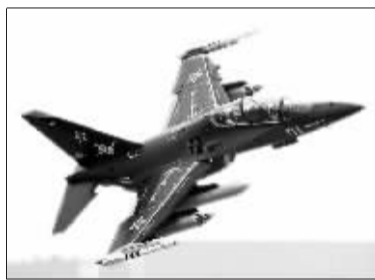
俄军雅克-130高级教练机

谢尔久科夫5日在接受媒体采访时说:“这种情况(不好的天气条件)可能会发生。届时我们会把项目减少到96架。被迫把重点放到直升机上,因而减少飞机数量。军事飞行员们将在阅兵式上展示几乎所有类型的飞机和直升机,最大程度地利用邻近莫斯科的卫戍区的装备,但是也有远程飞行的,如战略轰炸机就将从其所在的恩格斯基地起飞。总之,阅兵的空中部分确实是一项非常复杂的工作。飞