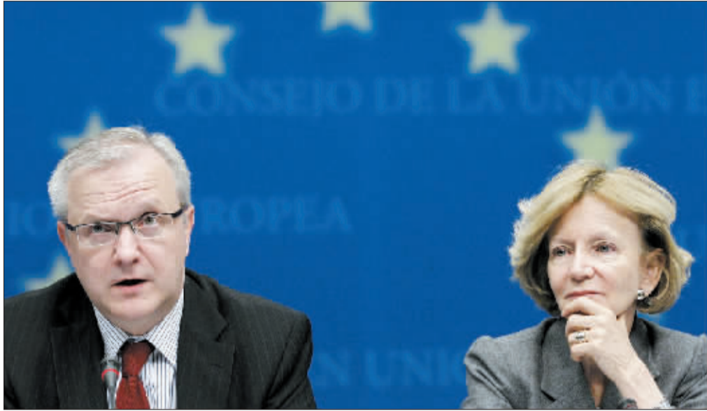
5 月 10 日, 欧盟委员会负责经济和货币事务的委员奥利·雷恩(左)和西班牙经济和财政大臣埃莱娜·萨拉加在欧盟财长特别会议后召开新闻发布会。

在会后发表的一份声明中, 与会财长们承诺, 将尽可能地加快步伐削减赤字和推行结构性改革, 以实现财政稳固和经济增长。作为最有可能步希腊后尘的欧元区成员国, 葡萄牙和西班牙同时承诺, 将在今明两年加大力度削减赤字, 并