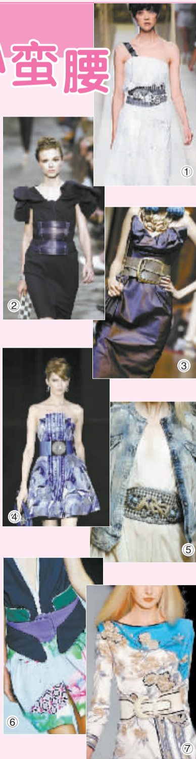
图7: 连身长裙通常容易乏味,即使是图案设计精美的长裙,仍需要一条腰带来分隔身材比例。这条镶有细细的黑边的白色皮带与长裙的图案和谐呼应,令设计浑然一体。(小寒)

图6: 这条蓝、紫、黑三色搭配的腰带令人印象深刻,它完美地划分了模特上身与下身的比例。一条艺术图案的花短裙,在腰带的衬托下更加出彩。