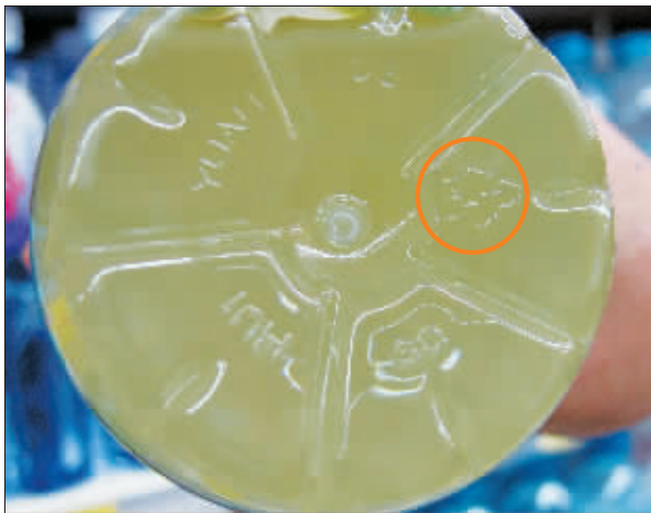
这个饮料瓶底部标的数字是1。

能够重复使用以及使用时的注意事项。“1”代表PET(聚对苯二甲酸乙二醇酯)。一般来说，矿泉水瓶、碳酸饮料瓶、功能饮料瓶都是这种材质。但要注意，这种瓶子不能盛70℃以上的热水，否则瓶子会释放出致癌物质。”该工作人员说。他还提到，如果一个塑料瓶的底部标注着“3”，建议大家不要用它盛水：这种瓶子的材质为PVC(聚氯乙烯)，高温时容易释放出致癌物质。