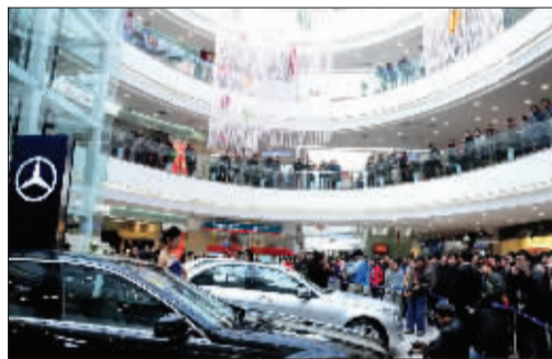
万达广场新车发布会。