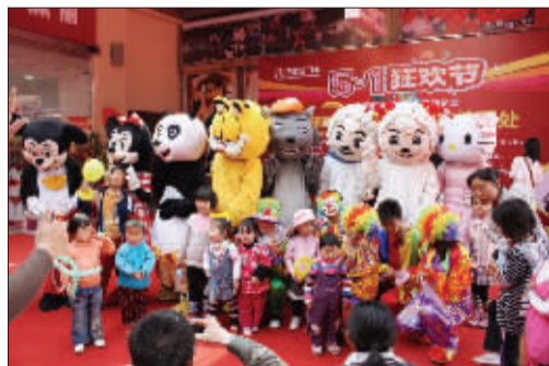
酷热卡通玩偶大巡游。