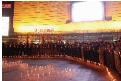
万达广场员工为玉树同胞祈福。

3月29日,由150余名消防官兵、25辆消防车,1000余人参与的万达广场大型消防演练的精彩场面,让人们