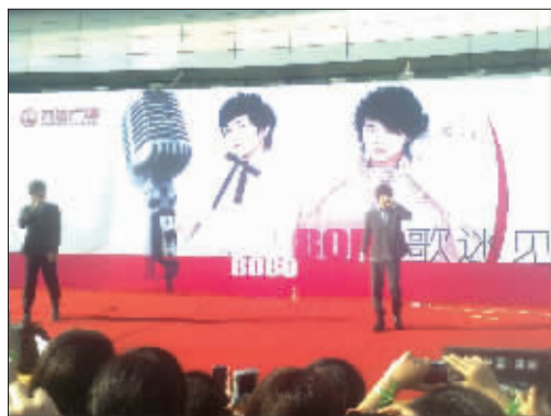
亚洲偶像天团BOBO组合献唱万达广场。