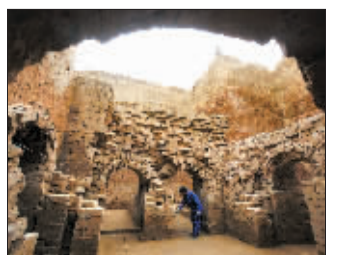
发掘现场内景。