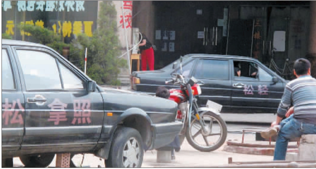
这家驾校的训练场,设在一酒店门前小小的一块空地上。

其实,国家对驾校有明确的要求和规定。包括:驾校训练场面积不能小于15亩,一级、二级、三级驾校拥有的教练车分别不能低于50台、20台和10台,所有教练车须具有有效行驶证,所有教练车须符合相关车辆检测标准,驾校必须建立培训记录制度……但从记者