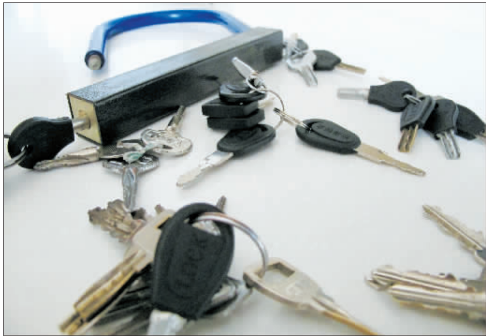
记者用窃贼的钥匙打开的电动车U形锁。