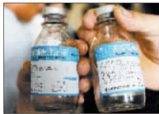
患者家属展示过期药药瓶。

25日，哈尔滨市传染病医院七病区的医护人员给17名麻疹患儿误输了名为“肌昔葡萄糖注射液”的过期药，这些患儿经专家会诊后没有发生不良反应。与此同时，患者家属却认为该药物加重了麻疹患儿的病情，聚众围堵医院要求给出解释并救治患儿。图为一名家长出示自己孩子在重症监护病房内的照片。