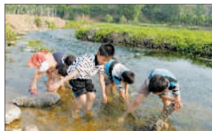
涧河磁涧镇老井村段，河水依然清澈。

采访组刚到同乐寨涧河桥，就闻到一股刺鼻的臭气。这一段的河水颜色更黑了，灰黑色的河水上飘着很多油膩，河水中竟然还有一具小猪的尸体，已经腐烂。