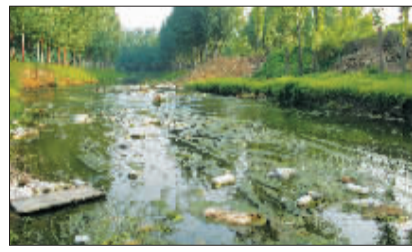
310国道涧河大桥下，河水中已开始出现垃圾。