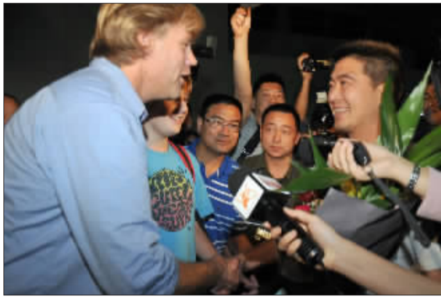
国内外媒体共同见证了这跨国一握。