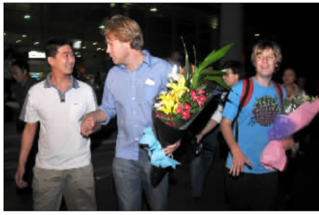
虽然语言不通，但不妨碍愉快交流。