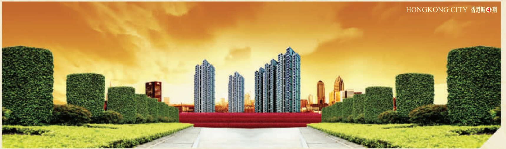
HONGKONG CITY 香港城 4期

据介绍，古城乡黄屯村102户500余名拆迁群众首批入住龙丰小区后，该乡的白村、庞屯两个行政村近4000名村民也将陆续分房入住。