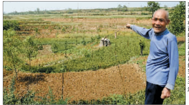
寒亮村西的瀍源湖已经完全干涸。

然而让人期待的是,人们将从小浪底水库引来黄河水,注入九泉水库,这一工程已经接近尾声。不久之后,九泉水库将成为真正意义上的瀍河源头。