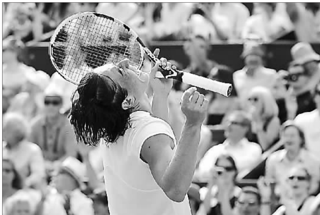
斯齐亚沃尼庆祝胜利。