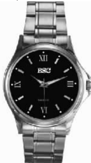
“百岁磁降压表”荣获第三届专利技术博览会金奖。美国国立研究院重点推荐的绿色降血压保健品金奖。