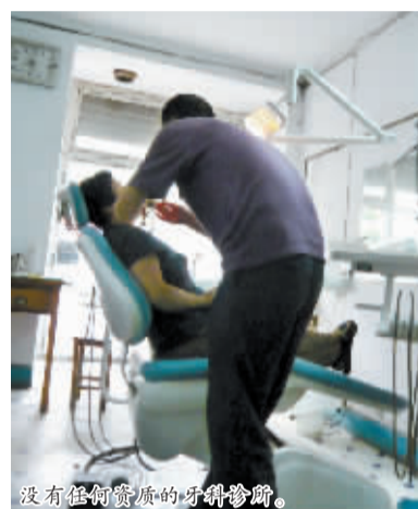
没有任何资质的牙科诊所。