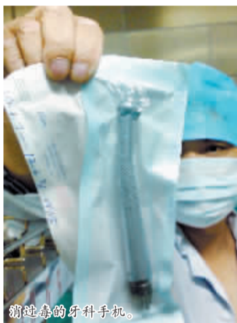
消过毒的牙科手机。