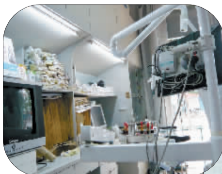
屋内脏乱的牙科门诊。

其次,要注意查看牙科诊所的消毒措施和卫生情况。进入病人口腔内的所有诊疗器械,必须达到“一人一用一消毒或者灭菌”的要求;患者的诊疗空间要尽量一人一室,或是有最少1.5米高的隔断,这样才能降低感染病毒的概率;医务人员进行口腔诊疗操作时,应当戴口罩、帽子,可能出现病人血液、体液飞溅时,应当戴护目镜。医务人员每次操作前及操作后应当彻底洗手或者给手消毒;戴手套操作时,每治疗一个病人应当更换一副手套并洗手或者给手消毒。还有就是要注意医生给病人使用的是否是消毒或一次性用具。常规检查用的一次性托盘,带灭菌标志独立密封包装的手机和在消毒盘盛放的小部件等都要认真查看,有疑问可以让医生更换。