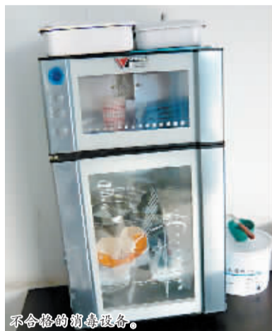
不合格的消毒设备。