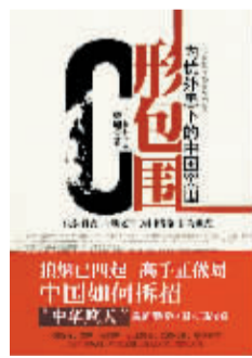
戴旭 著 文汇出版社

本书是作者通过数年研究,用半年时间写成的世界全景式政治、军事巨作。观此书,会让我们明白今天世界的本真相,会让中国人——大部分被盛世、崛起等“迷幻药”熏得迷迷糊糊、形同梦游的中国人,突然清醒并惊出一身冷汗。作者不仅悄悄地告诉国人四周全是狼群,还以其无可置疑的历史睿智告诉同胞们:为什么中国在劫难逃。