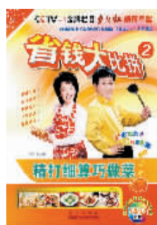
黄娟娟 著 青岛出版社

做节目有点像下馆子,打眼一看,顾客满堂的肯定是物美价廉,那些装修豪华的地方,人气还不如家常小馆旺。为什么呢?因为人们日子再好,吃的东西还是那么简单,饭菜可口就行。《省钱大比拼》最近打出“快速懒人菜”的招牌,只要十几分钟,一道实惠、营养、省钱的大菜就能上桌。学会“懒人菜”,老年人不耽误遛弯,年轻人不耽误上班,多好。