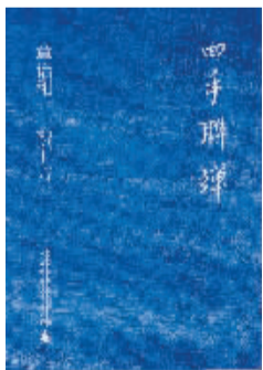
章诒和 贺卫方 著 广西师范大学出版社

章诒和,一位受国人瞩目的人文学者;贺卫方,一位颇具争议的北大教授。两位学者代表两代知识分子,破天荒联手著书,名曰《四手联弹》。章诒和的专业是戏剧,贺卫方从事的是法学,《四手联弹》加入贺卫方的摄影作品,把章诒和的戏剧和贺卫方的法学“放到一个锅里去煮”,“煮出来的,便是‘戏法’”。