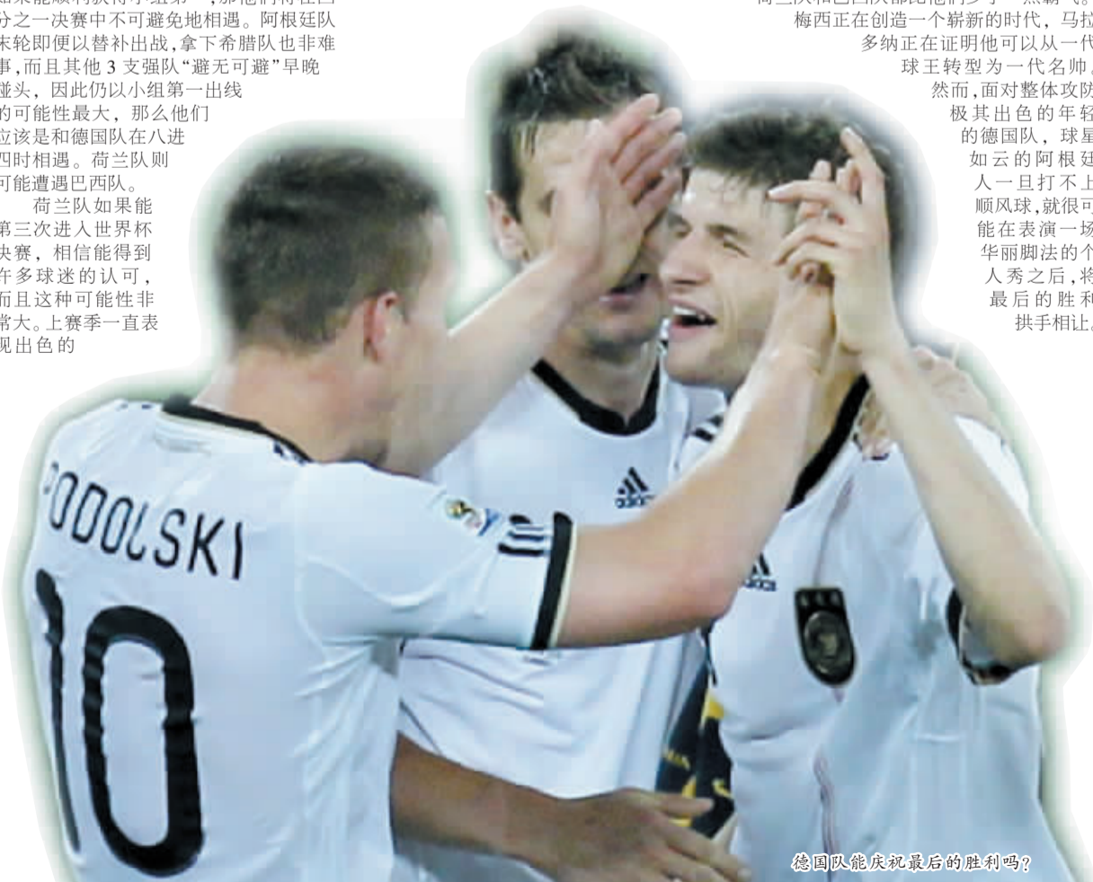
德国队能庆祝最后的胜利吗?

梅西正在创造一个崭新的时代,马拉多纳正在证明他可以从一代球王转型为一代名帅。然而,面对整体攻防极其出色的年轻的德国队,球星如云的阿根廷人一旦打不上顺风球,就很可能在表演一场华丽脚法的个人秀之后,将最后的胜利拱手相让。