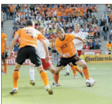
阿根廷队、巴西队、荷兰队在小组赛中。