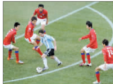
五名韩国队员“围剿”梅西的场面让人想起了马拉多纳曾经独享的“礼遇”。

马拉多纳的战术复辟成效显著,但问题还是来了:梅西盘带、过人固然厉害,可他仍难比肩24年前的老马本人。谁能顶上中场空白?当年有大胡子巴蒂斯塔,有恩里克,甚至有蓬皮多,但老马麾下的潘帕斯部队明显攻强守弱。阿韩之战,韩国人下半场相当长一段时间就是这么干的:压制梅西身后空挡,在中后场大片区域掀起狂潮。