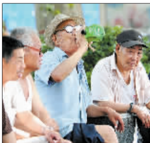
自带水壶，随时补水。