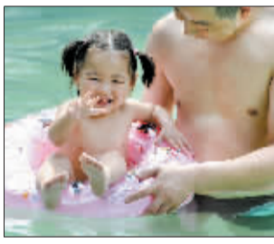
游泳池内，戏水降温。