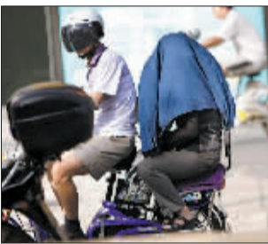
千方百计，搞好防晒。