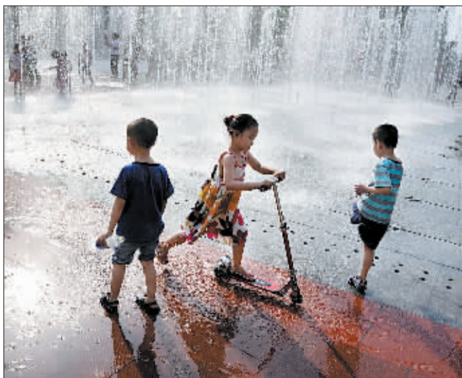
广场喷泉旁，欢快撒个野。