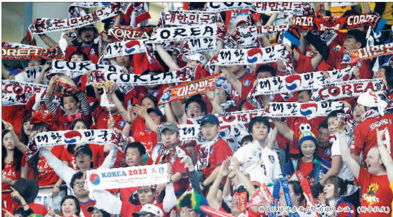
韩国队球迷在看台上为球队加油。

南非世界杯十六强对韩国队来说,意义深远。这不仅是韩国队非主场作战的首个世界杯十六强,也是继2002年韩日世界杯之后,韩国队在世界杯历史上第二次打入世界杯十六强,同时也是由韩国本土主帅带队取得的最好成绩。