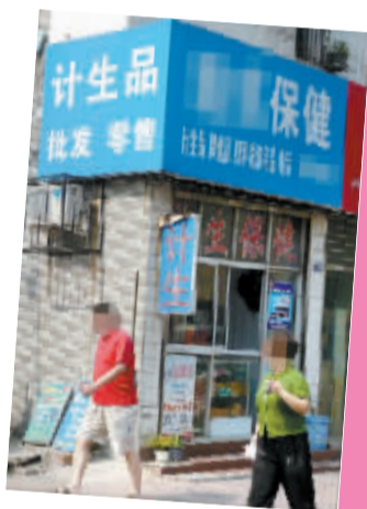
“万艾可”的广告在性保健品店被放到了醒目位置。