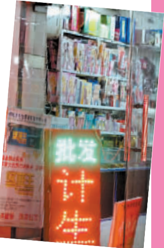
打着“计生”旗号的性保健品店。

一块“计生用品”的招牌、一间狭小的门面、一些包装花花绿绿的产品,再加上吹嘘“神奇”功效夸张的广告词,这就是我们经常能在街头巷尾看到的性保健品