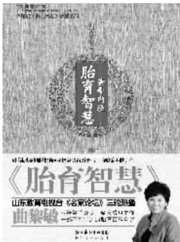
作者 曲黎敏 长江文艺出版社