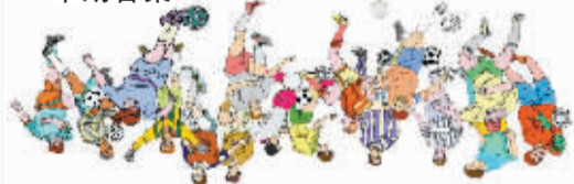
练眼神答案:一共有16位球员