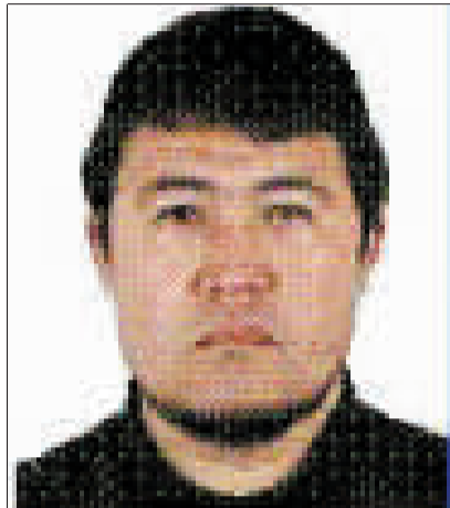
恐怖组织头目依明·色买尔系“东突”恐怖势力骨干。