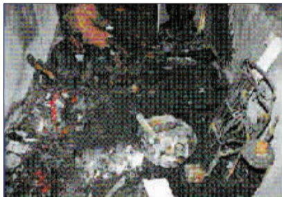
阿不都热西提·阿不来提、依明·色买尔制爆、试爆时发生爆炸的 2 处现场。