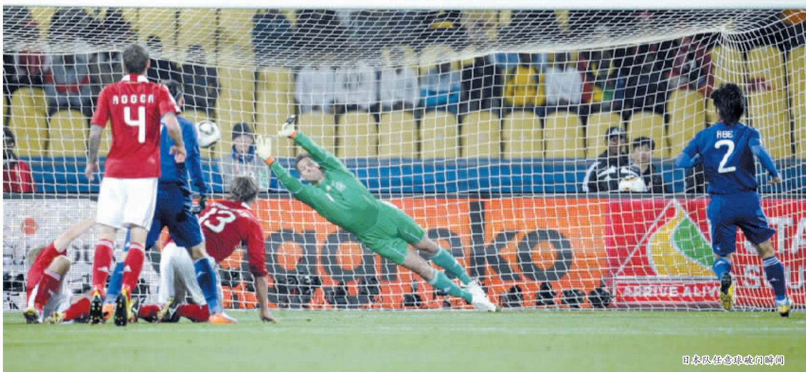
日本队任意球破门瞬间