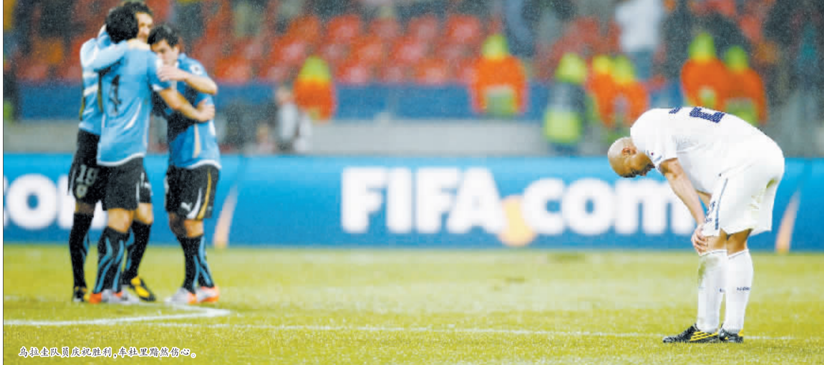
乌拉圭队员庆祝胜利,车杜里黯然伤心。