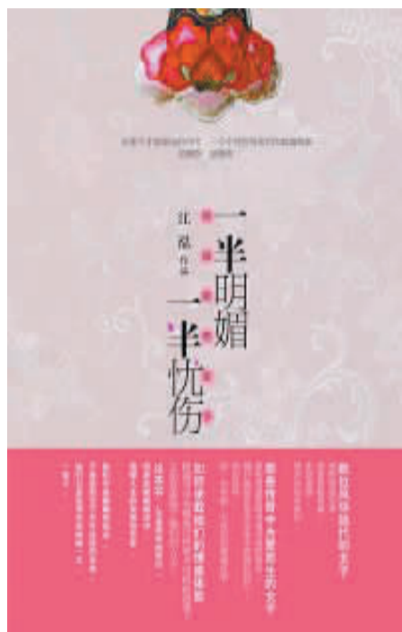
书名：《一半明媚一半忧伤：民国那些女子》 作者：江泓 出版社：文化艺术出版社

添几分疯魔，一心追求爱、自由和美的诗人简直疯狂了。可是，现实粉碎了他的梦想，命运对他，正如同他对张幼仪一样无情和冷漠！