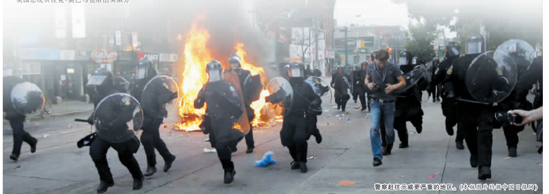
警察赶往示威更严重的地区。

为保障峰会顺利召开,加拿大政府投入近10亿美元用于安保工作,调动全国上万名警察支援多伦多。22日,当地警方逮捕一名企图在峰会期间制造爆炸事件的男子。(张品秋)