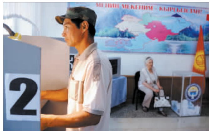
6月27日,吉尔吉斯斯坦民众在首都比什凯克一投票站内参加公投投票。

新华社供本报特稿 吉尔吉斯斯坦6月27日举行全民公投,以决定是否通过临时政府提出的新宪法草案以及是否认可由萝扎·奥通巴耶娃担任过渡时期总统。