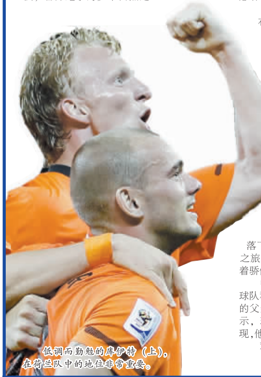
低调而勤勉的库伊特(上)，在荷兰队中的地位非常重要。

不过，除了埃利亚侮辱摩洛哥人风波和范佩西的小小波澜外，荷兰还算风平浪静。布拉鲁兹在出征前接受采访时表示：“队内没有任何矛盾和问题，气氛好极了，球队在我看来是超级23人组。”