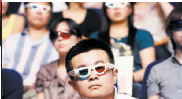
观众戴着3D眼镜观看3D电视剧。

从山东电视台齐鲁频道短信互动平台来看，观众观看这部电视剧的热情相当高涨。有观众留言说：“头回看3D电视剧，十分兴奋，孙悟空的金箍棒都快冲出电视屏幕飞到眼前了！”