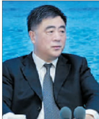
国家广电总局新闻发言人朱虹