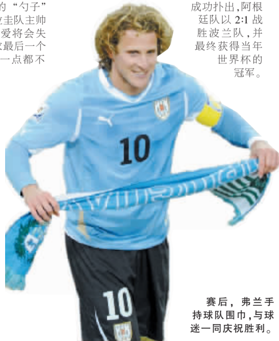
赛后,弗兰手持球队围巾,与球迷一同庆祝胜利。

其实,苏亚雷斯关键时刻的“一手擎天”也在世界杯史上有迹可循。在1978年阿根廷世界杯上,在阿根廷队与波兰队的比赛中,波兰队传奇球星拉托头球攻门,阿根廷队守门员已经失位。危急之际,肯佩斯像排球运动员一样,用敏捷的托球动作把皮球托出球门外。随后,波兰队球员罚出的点球被阿根廷队守门员成功扑出,阿根廷队以2:1战胜波兰队,并最终获得当年世界杯的冠军。