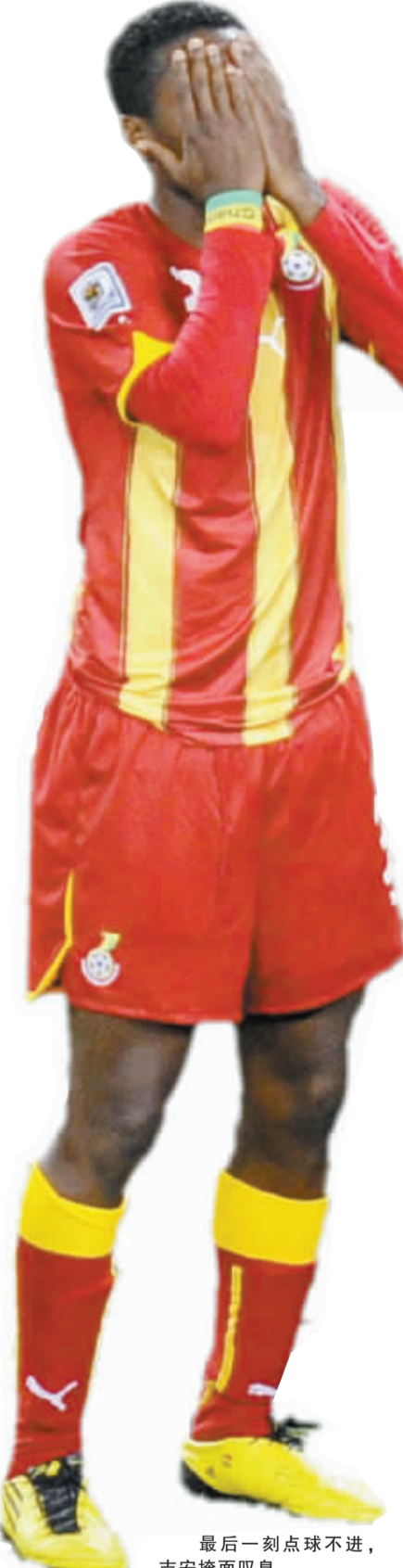
最后一刻点球不进,吉安掩面叹息。