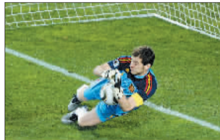
卡西利亚斯扑球瞬间。