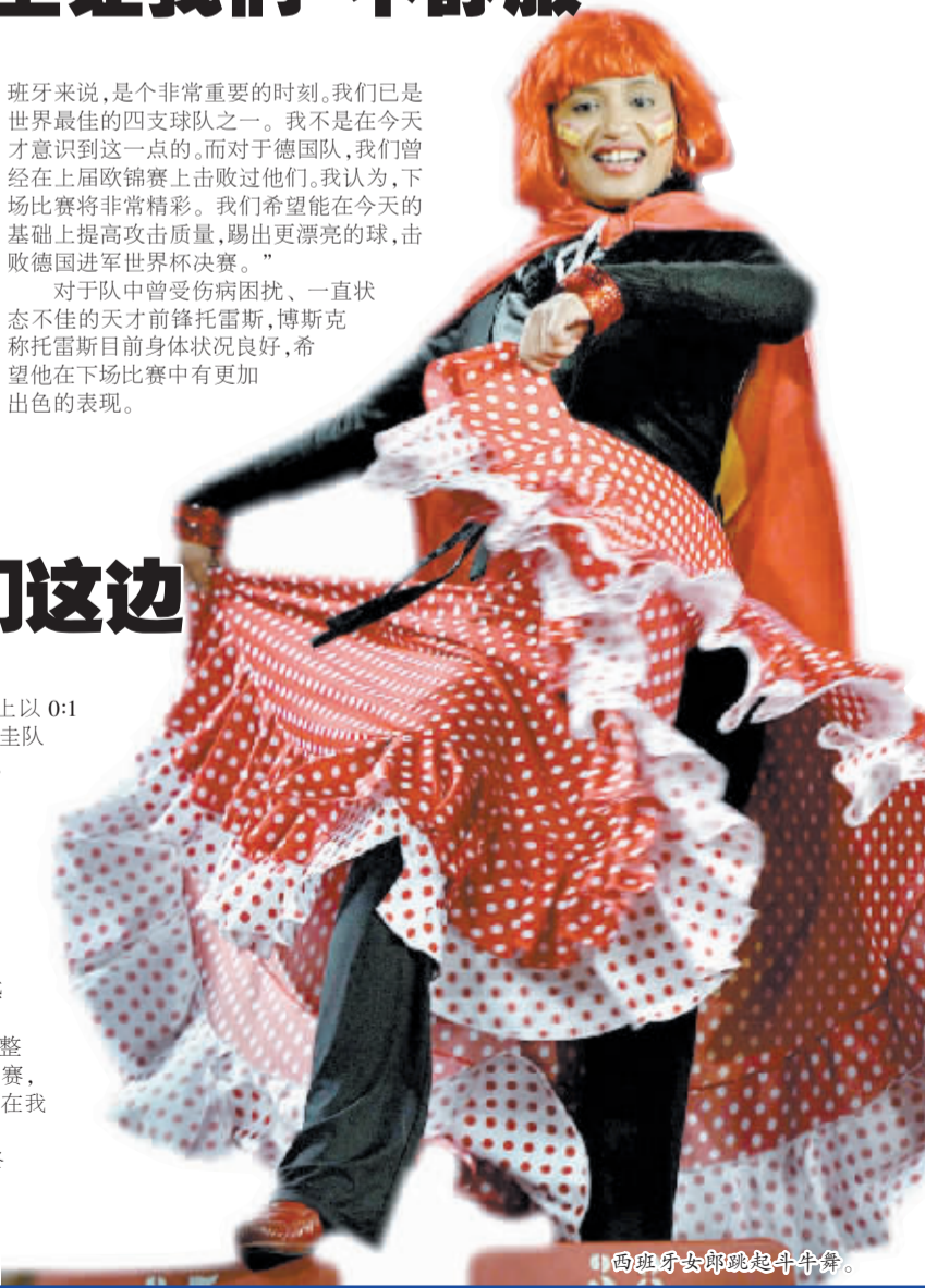
西班牙女郎跳起斗牛舞。

这位主帅还指出，巴拉圭在这场比赛中始终让两名队员随时准备进行快速反击，但西班牙队在传球方面很出色，没有机会发挥。