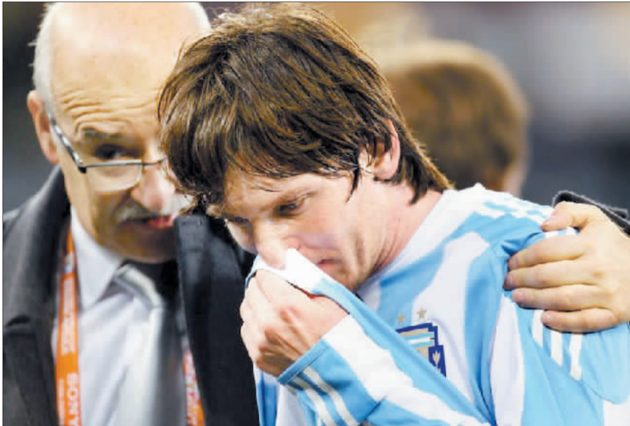
阿根廷队助理教练赛后安慰梅西。

阿根廷队在世界杯上停止了前进的脚步。阿根廷队的头号球星梅西也以一球未进的惨淡纪录告别了南非世界杯，令阿根廷球迷和媒体感到无比失望，但主教练马拉多纳依然认为梅西表现很优秀。