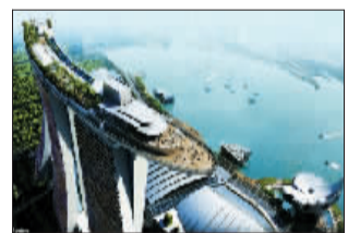
扑克牌造型的滨海湾金沙酒店。