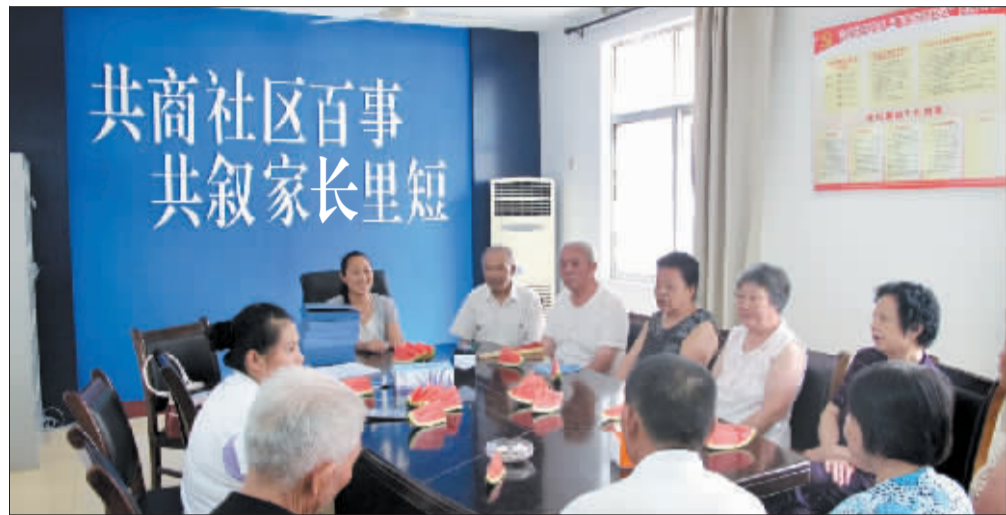
社区工作人员和“居民议事委员会”成员一起研究工作。

涧西区六冶社区有57名“居民议事委员会”成员，常常和9名社区工作人员一起“共商社区百事 共叙家长里短”