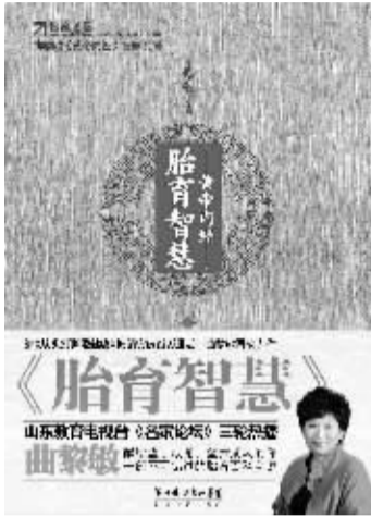
○作者 曲黎敏 长江文艺出版社

如果问世界上哪个国家最重视孩子的教育，非中国莫属；如果问哪个国家的父母在孩子身上投入的精力最大，还是咱中国的家长们当仁不让。看看咱们国家有多少种给孩子开的兴趣班吧：从音乐舞蹈到书法国画；从外语奥数到体育运动……真是数不胜数。这其实是中国自古以来一个传统——重视教育，重视传宗接代的质量。