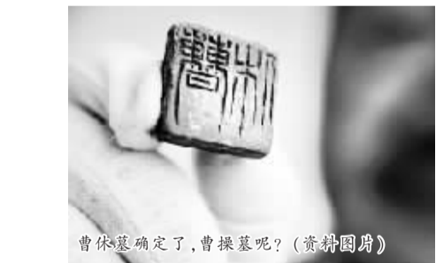
曹休墓确定了,曹操墓呢?(资料图片)

作的我市第二文物工作队队长史家珍说:由于该墓位于东汉帝陵附近,很长一段时间内,考古工作者一直以为这是东汉帝陵中的一座陪葬墓,墓的规模大,似是贵族墓。