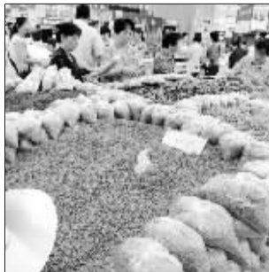
目前北京市场绿豆、大蒜价格大幅下跌。(资料图片)

近期,绿豆、大蒜等前期涨幅较大品种价格快速回落,蔬菜等农产品价格普遍下降。目前北京新发地批发市场绿豆、大蒜价格分别为每公斤13.5元和9.2元,比前期最高点下跌30.8%和12.3%。鲜菜价格5月份以来持续大幅回落。