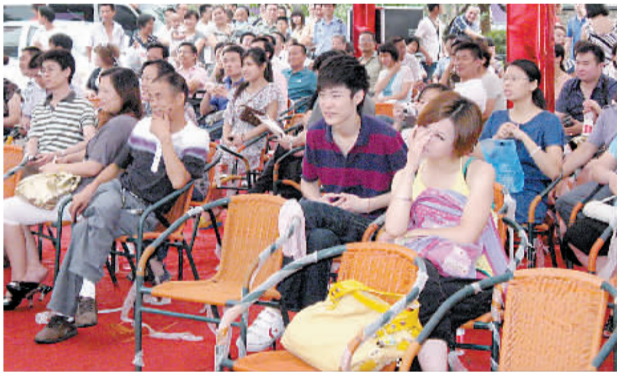
7月3日，东方今典“境界”盛大开盘，近300名购房者亲临现场参加了此次公开选房活动。据了解，东方今典三期洋房“境界”共规划8栋住宅，户型面积从100平方米到220平方米不等。三期洋房延续了一期的特点，酒红色外表，层层退台，270°景观飘窗，户户有花园，相比于一期洋房，三期配有电梯，设计更加人性化。图为在等候区等待选房的客户。

目前，地产界较为普遍的共识则是，年底开发商面临着资金压力，需要钱支付工程款和银行贷款，将大规模地推盘，回笼现金。(邹伟)